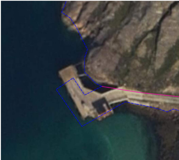
Figur 3 Privat kai før undersjøisk ras