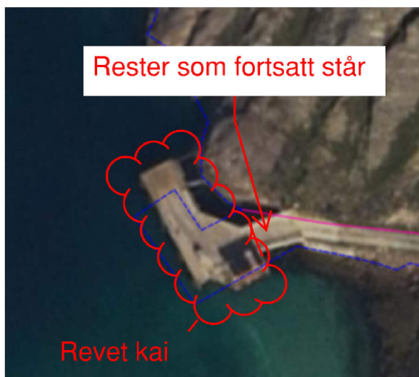
Figur 4 Kai etter rydding

Eieren av kaien kontaktet Rødøy kommune angående denne saken, for å undersøke om det fantes noen tilskuddsordning til å gjenoppbygge kaien, etter som at han ikke har mulighet til å gjennomføre dette i egenregi. Teknisk har undersøkt litt angående dette, både hos Fylkeskommunen og hos Statsforvalteren, men det er kun kommunale næringsfond som kan benyttes til å finansiere private kaier. Rødøy kommune sitt næringsfond har relativt lave tilskuddsbeløp for slike saker, og i dette tilfellet vurderte eieren at det er så lavt at dette ikke vil hjelpe til med å realisere en ny kai.