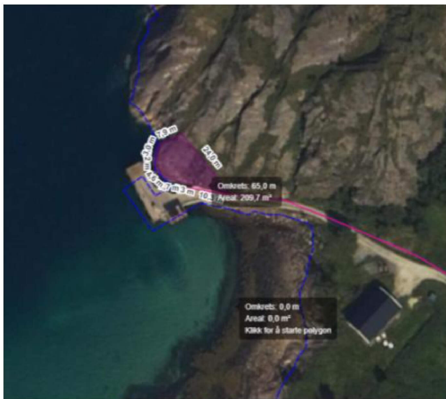
Figur 1 Anslått område for etablering av kai

Det søkes støtte gjennom regionalforvaltning, og maksimalt ytes det tilskudd på 50% av investeringsbeløpet, noe som tilsier at den reelle kostnaden til Rødøy kommune kan bli 3,25 MNOK.