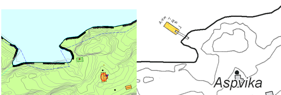
Bildene viser området for det omsøkte tiltaket

Det kommer frem i erklæring om ansvarsrett at utførende kontroll av fortøyning av flytebryggen vil bli utført av Willy Pedersen entreprenør fra Øresvik.